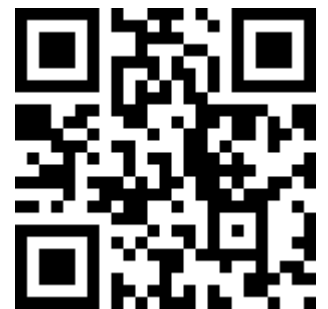
報名 QR Code