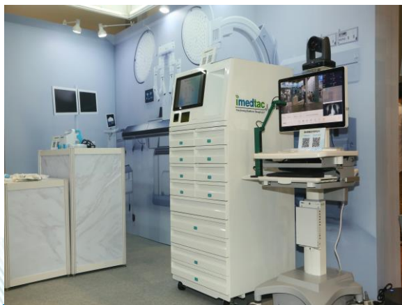
⊕ 醫院 / 診所設備