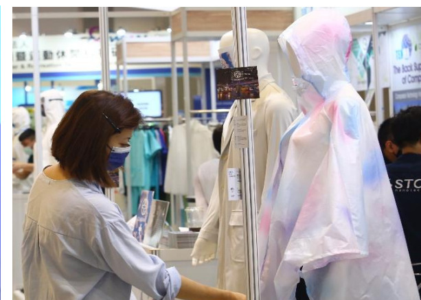
🏠 醫療耗材及紡織品