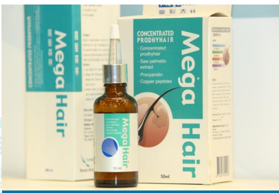
👤 民生健康 美容用品