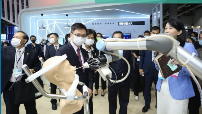
智慧手術導航系統