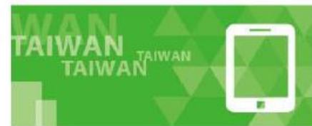
電子資訊類別展會