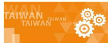
木工機／工具機類別展會