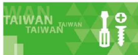
五金零配件類別展會