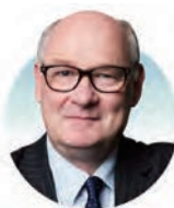
范智廉爵士 安本集團; IP Group