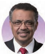
譚德塞博士 世界衛生組織