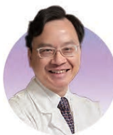
盧煜明教授 香港科學院; 香港中文大學