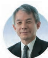
原丈人 Alliance Forum Foundation; DEFTA Partners