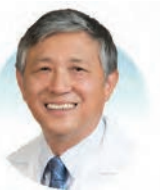
許家傑教授 美國加州大學洛杉磯分校 東西醫學中心