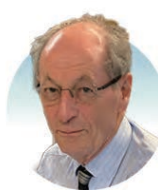
Michael Marmot爵士教授 倫敦大學學院