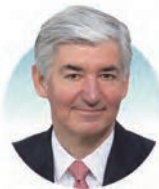
司明麒爵士 葛蘭素史克