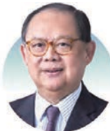
諸立力 第一東方投資集團